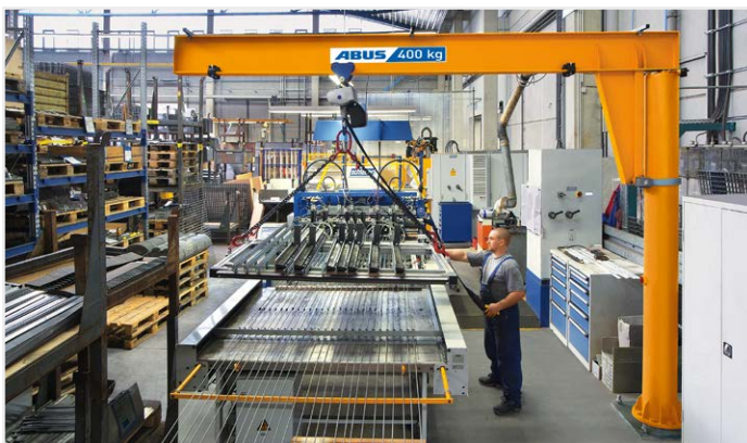
Rondom beweeglijk ABUS-kolomzwenkkransen tot 6,3 t

Hier ziet u een selectie van onze hijswerktuigen in de licht- en middelgewichtsklasse.