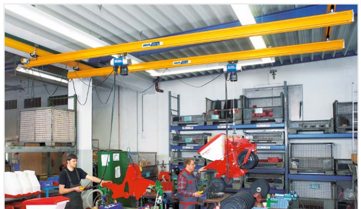
Meer ruimte voor mensen, machines en materiaal ABUS HB-systemen tot 2 t