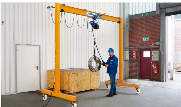
De universele kraan Lichte portaalkranen tot 2 t