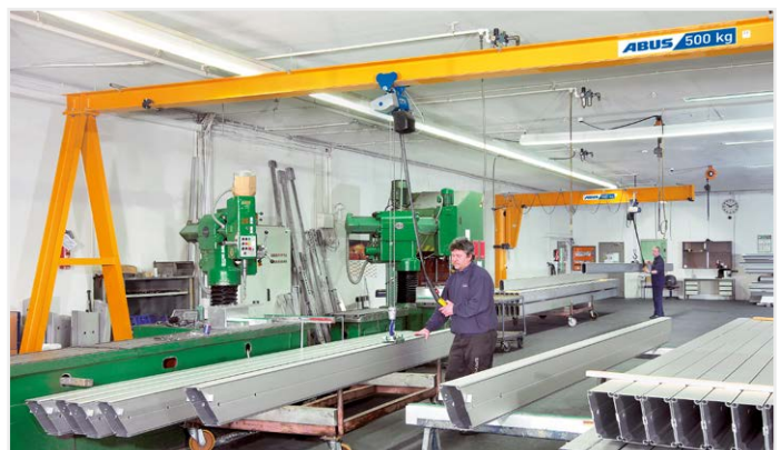
Lineaire transportoplossingen voor grote lasten Enkelrails loopkatbanen van ABUS tot 16 t