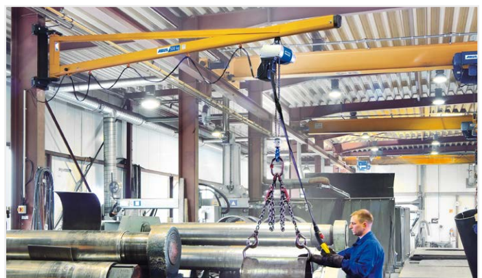
Die tilt ook als je geen voet aan de grond krijgt: ABUS-wandzwenkkransen tot 5 t

ABUS Kraansystemen BV - Merianweg 1-3 - 3401 MR IJsselstein - Telefoon: 030 6888360 - Telefax: 030 6888900 - E-Mail: verkoop@abus-kraansystemen.nl