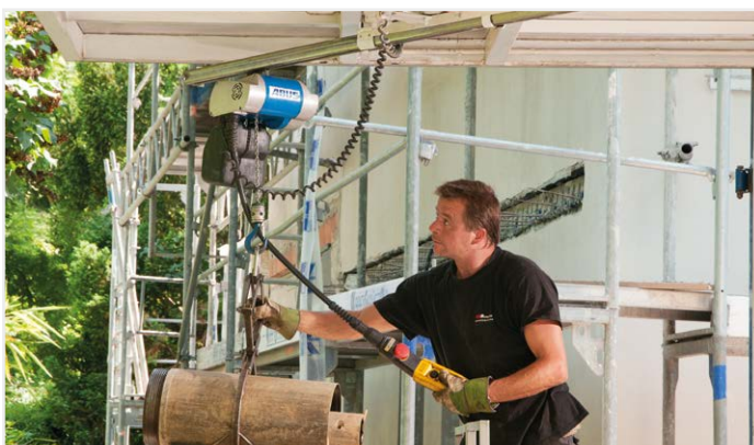
Overal beschikbaar Elektrische kettingtakels van ABUS tot 4 t