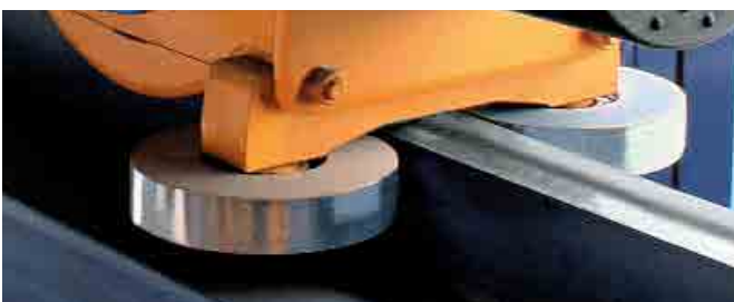
Geleidingrollen bij de bovenste kraanbaan