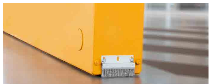
Rijwielen op de vloer zonder geleidingsrails